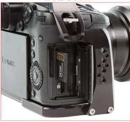
ACCÈS FACILE À LA PORTE DE CARTE MÉMOIRE DE LA CAMÉRA

THE HEIGHT OF THE FRONT ROD BLOC CAN BE ADJUSTED TO FIT ACCESSORIES