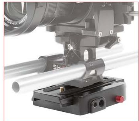
UNE PLAQUE DE RELÂCHEMENT RAPIDE EST INCLUSE POUR PLUS DE STABILITÉ

A QUICK RELEASE PLATE IS INCLUDED FOR MORE STABILITY