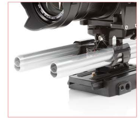
LA HAUTEUR DU ROD BLOC FRONTAL AJUSTABLE POUR INSTALLER DES ACCESSOIRES

THE HEIGHT OF THE FRONT ROD BLOC CAN BE ADJUSTED TO FIT ACCESSORIES