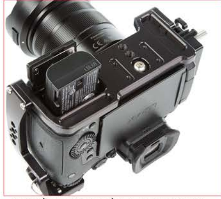
ACCÈS FACILE À LA PORTE DE BATTERIE DE LA CAMÉRA

A QUICK RELEASE PLATE IS INCLUDED FOR MORE STABILITY