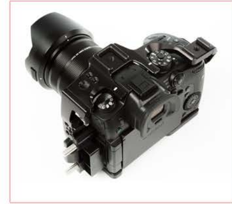
LA CAGE EST CONÇUE POUR ACCÉDER AUX FONCTIONS PRINCIPALES DE LA CAMÉRA