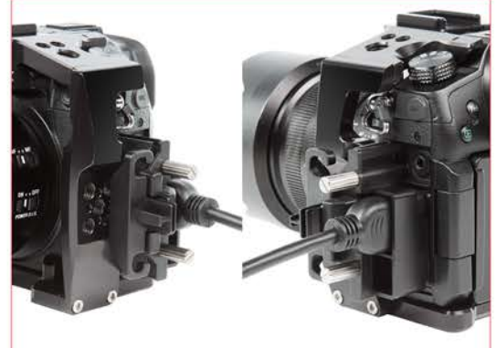
ACCÈS FACILE AU PROTECTEUR DE CÂBLES DE LA CAMÉRA